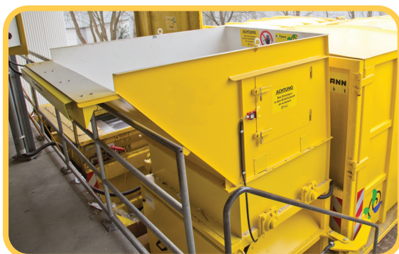
Schneckenverdichter für Trockenabfälle