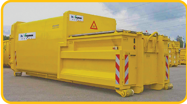
Stempelpresse für Trockenabfälle