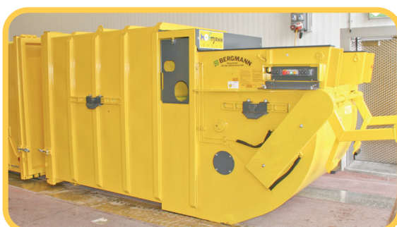
Schwingkolbenpresse für Naßabfälle